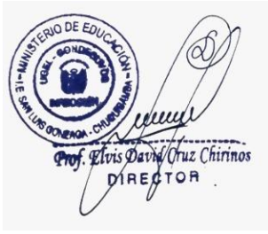
FIRMA DIRECTOR (A)