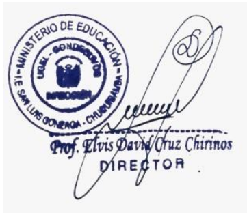
FIRMA DIRECTOR (A)